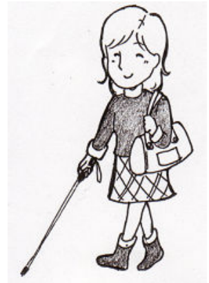
イラスト・あじの