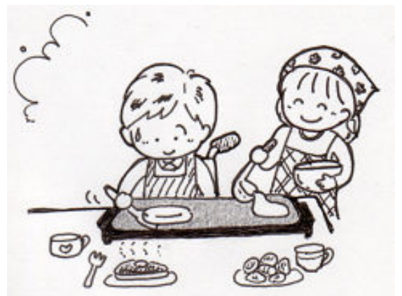
イラスト・あじの