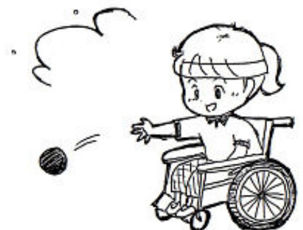
イラスト・あじの