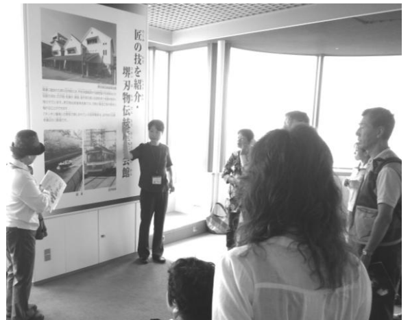
堺ボランティアガイドによる説明

参加者から、「今日の見学の内容はとてもよかった」、「手話通訳者のおかげで内容がよくわかった」、「堺市は素晴らしい。次は自転車博物館を見たい」など感想をいただきました。