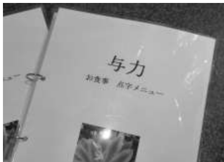
食事と飲み物の2種類があります。